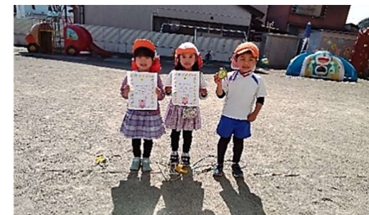
縄跳び大会みんながんばったよ♡