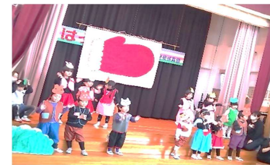
発表会頑張りました!

3月31日から4月3日(年長は31日)は、希望保育を行います。 (3日は、11:30 降園です) 13日までに申請をお願いします。 ★13日を過ぎた場合は受け付けいたしませんのでご了承ください。 ★30日は、保育室のメンテナンスを行いますのでお休みです。 ご理解のほどよろしくお願ひいたします。