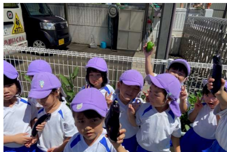
ナス・ピーマンを収穫!