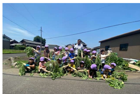
だいこん・じゃがいも!