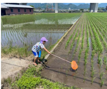
おたまじゃくし見つけた!