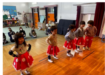
かわいいミッキーとミニーです！