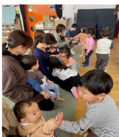
小さい子と触れ合いました☆