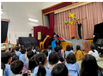
お話広場「どんぐり」さん！