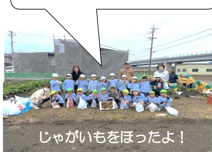
じゃがいもをほったよ！