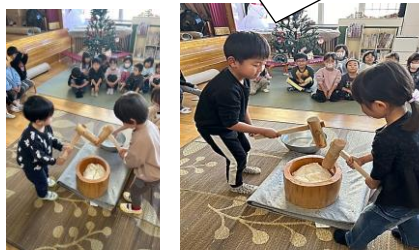
お餅つき、ぺったんこ！