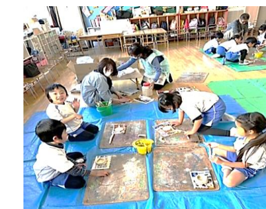
鉛筆立てを作りました！