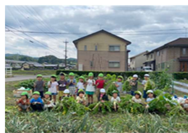
大根抜き、楽しかったよ！