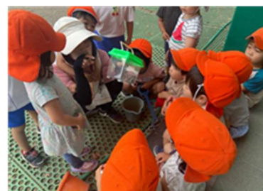
カナヘビ、見つけたよ！

6月は自然に触れたり、土に触れたり、季節を感じました。ダンゴムシも見つけていましたよ😊