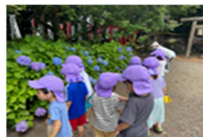
あじさいがきれいに咲いてたよ！